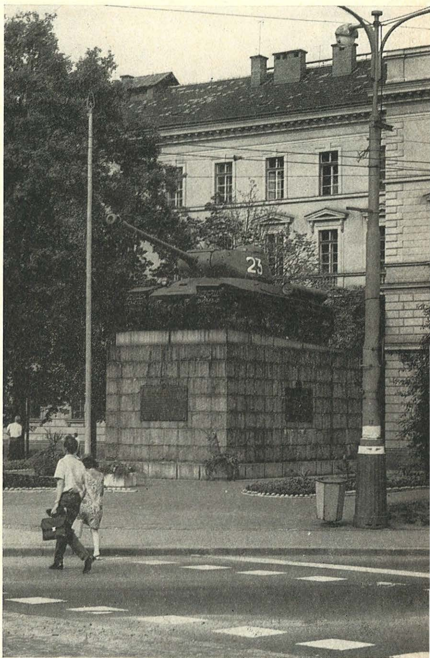
Pomník sovětských tankistů (snímek Z. M. Zenger)