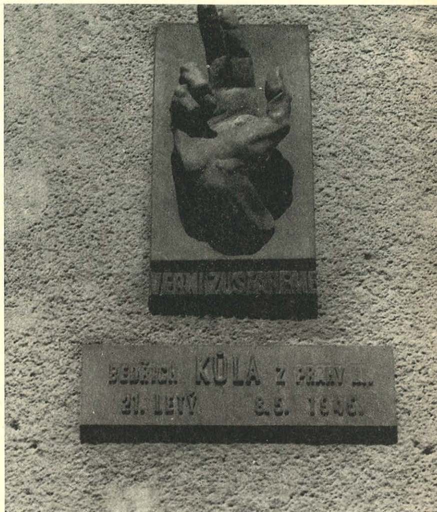
Jedna z pamětních desek padlým v Květnové revoluci

covní pomůckou pro odborné pracovníky na úseku památkové péče, pro funkcionáře strany a pracovníky obvodních národních výborů na úseku kultury a může pomoci při práci i pedagogům 3 .