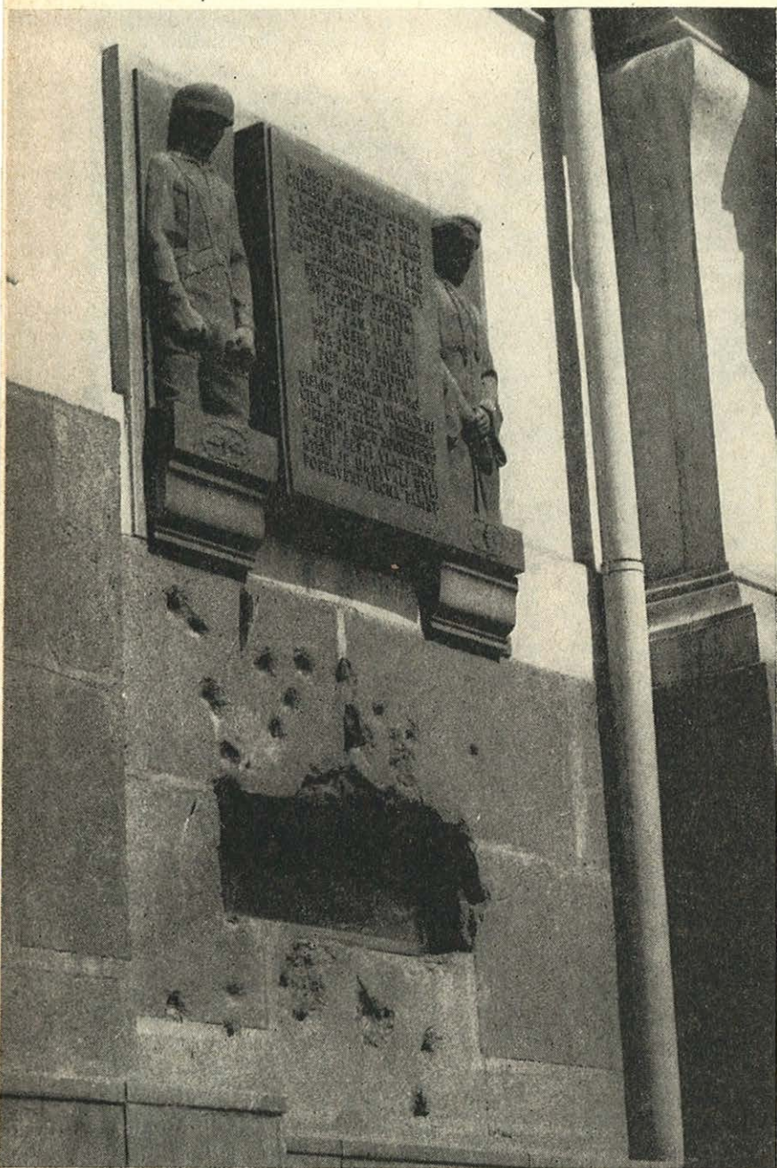
Pamětní deska čs. parašutistů na kostele sv. Karla Boromejského