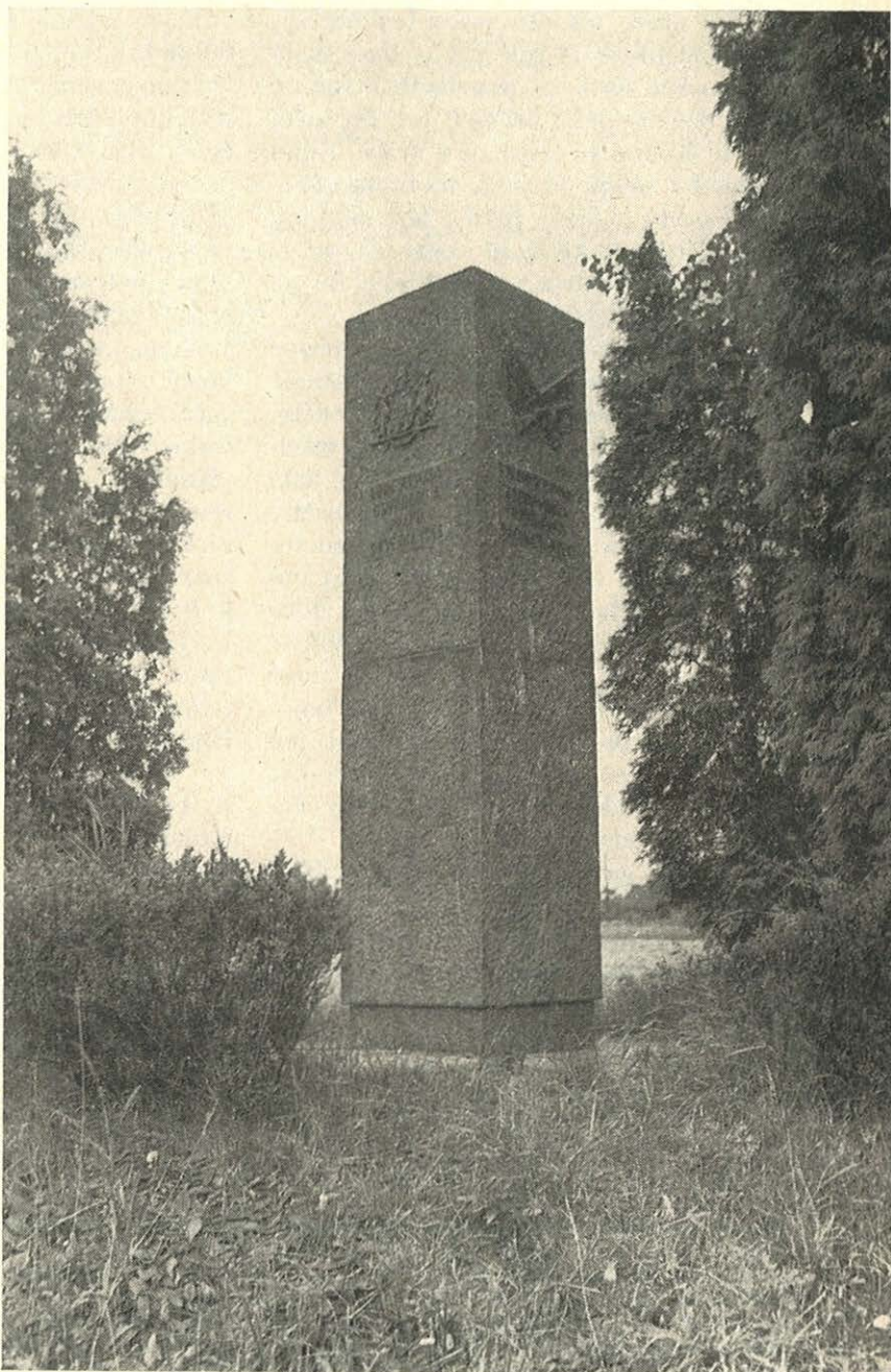
Stéla sovětské armády na Kladenské třídě