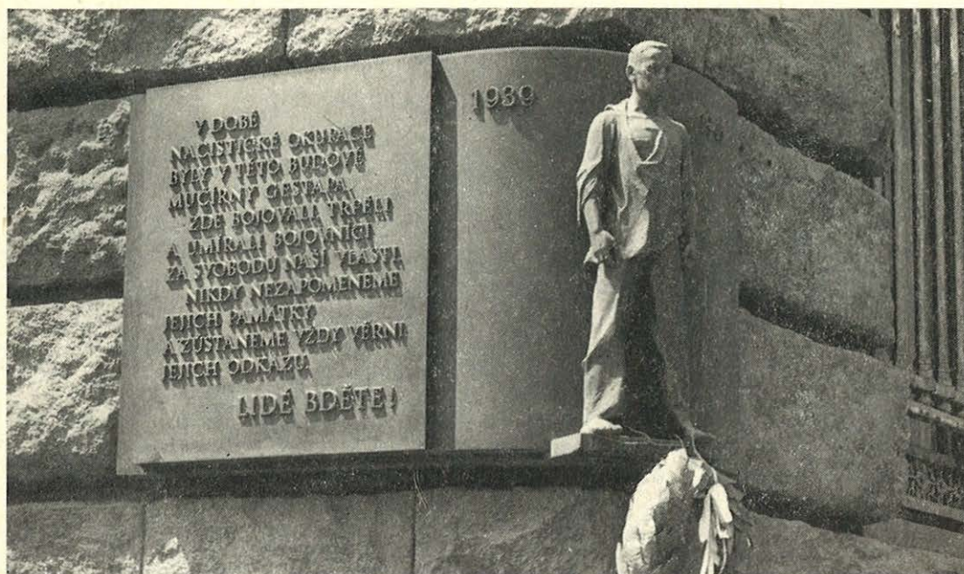
Pamětní deska na bývalém Petschkově paláci

ně zcela bez povšimnutí ani v literatuře 4 . Už v roce 1952 vyšla např. práce, která je vlastně průvodcem po památkách revolučních událostí v Praze. Tam jsou také připomenuta některá místa, která souvisí s událostmi za druhé světové války. Památky tohoto druhu pak připomínají i pozdější práce Jaroslava Soukupa a Františka Peřase. Všechny citované práce mají charakter průvodců, a to skoro výhradně po historických částech Prahy, nekladou si za úkol postihnout všechny památky tohoto druhu, a tím méně je hodnotit. Nicméně i formou průvodce a zběžné informace vzbuzující zájem lze vykonávat vliv ve prospěch památných objektů.