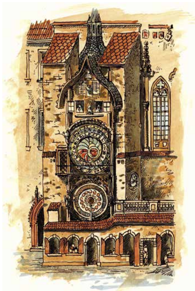
Obr. 3. Podoba orloje na sklonku 18. století. Ilustrace je provedena podle leptu Caspara Plutha z roku 1793. V přízemí orloje jsou patrné řemeslnické krámky, které zde stály až do 1. poloviny 19. století. Pracovali v nich „rodšmidi“, tedy soustružníci kovových předmětů. Ve spodní části orloje je vidět osazené, ještě barokní kalendárium. V roce 1866 bylo nahrazeno novou deskou s malbami Josefa Mánesa. V horní části jsou okénka pro apoštoly, ale nikoliv v podobě, jak je známe dnes. Datace umístění apoštolů na orloj je dodnes záhadou (kresba O. Šefců, 2010).

Na desce je vyznačena hranice svítání (AVRORA) a soumraku (CREPVSCVLUM), noc i den, východ (ORTVS) a západ (OCCASVS) a v zakřivených výsečích je vyznačen hvězdný čas pomocí hvězdičky na ukazateli spojeném se zvěrokruhem.