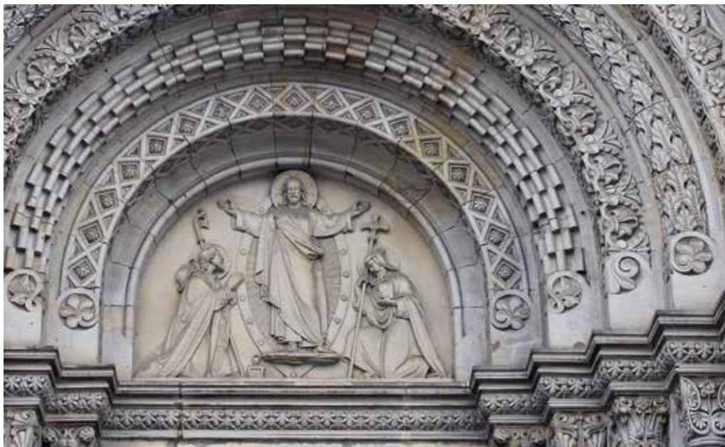
Obr. 5. Praha 8-Karlín, kostel sv. Cyrila a Metoděje. Václav Levý, 1867–1869: Kristus mezi sv. Cyrilem a Metodějem, tympanon hlavního portálu.

a na pravém je vyobrazeno Zvěstování Panně Marii. Ikonograficky je tak starozákonní výjev prvotního hříchu doplněn novozákonním výjevem Zvěstování, který oznamuje příchod Spasitele.