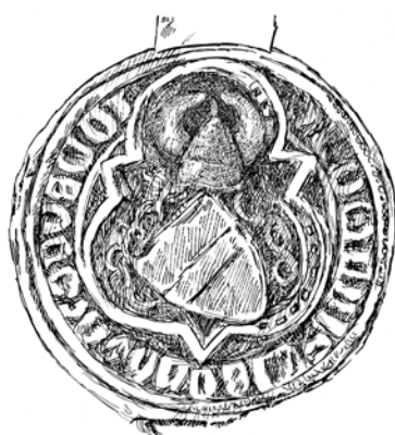
Obr. 7. Pečeť Johlina Jakobova z roku 1330 má v pečetním poli trilob se špičkami mezi obloučky, uvnitř se nachází šikmý štít s příčným břevnem. Potomci Jakuba Velflova užívali jako klenot rohy, čímž se odlišovali od ostatních rodových větví pražského měšťanského rozrodu Velflovičů. Zbytek pečetní plochy je vyplněn rozvilinami. Znamení je doplněno opisem + S. IOHANNIS . IACOBI . WOLVELINI (NA ŘKř, inv. č. 181; foto R. Soukup, 2018; kresba O. Šefců, 2018).