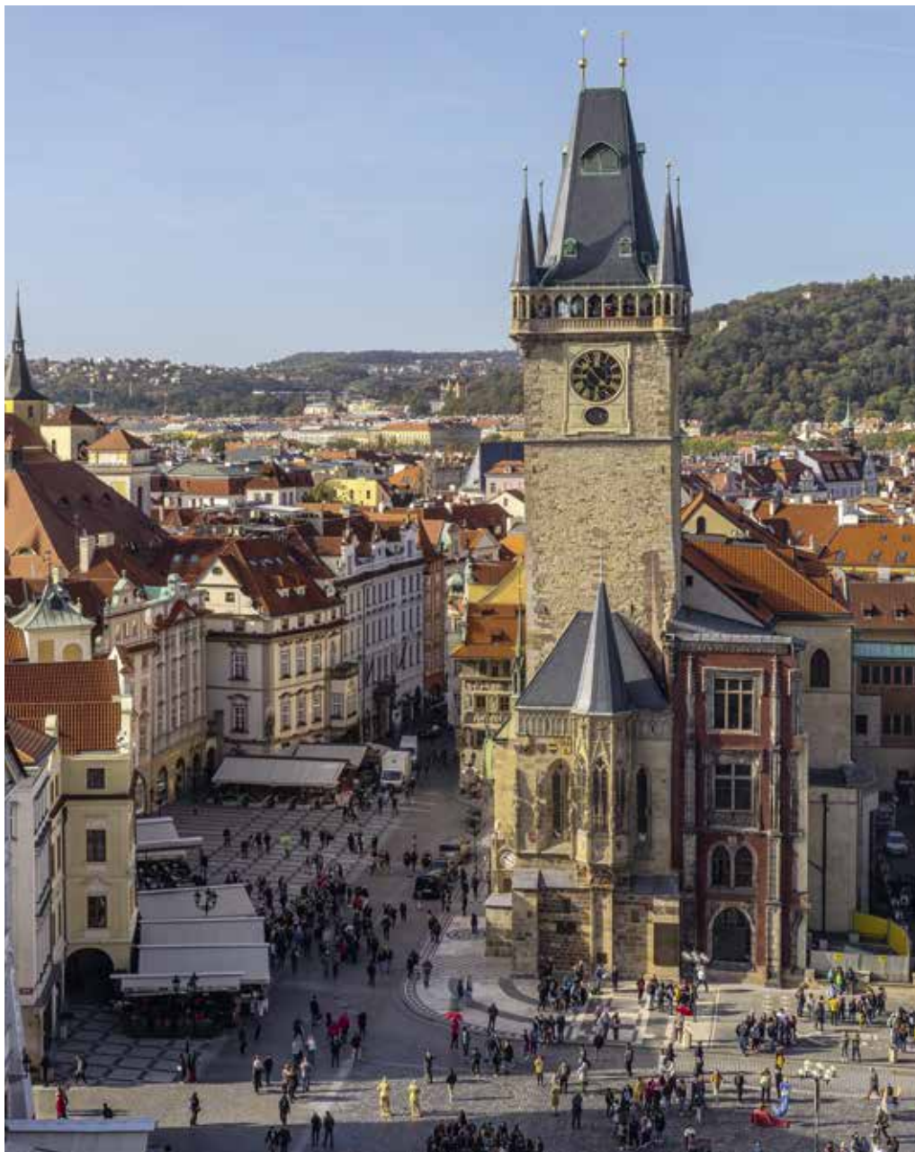
Obr. 28. Praha 1-Staré Město, čp. 1/I. Staroměstská radnice po dokončené generální rekonstrukci v říjnu 2018.

staroměstského obyvatelstva lze datovat již do přelomu 13. a 14. století, jejich sebevědomou a honosnou reprezentaci můžeme zachytit až kolem poloviny 14. století. Právě v této době se setkáváme s rostoucím množstvím příkladů, kdy jednotlivé řemeslnické dynastie užívají vlastní pečeti. Osoby typu Lva krejčího, Frowina zlatníka nebo nožíře Jakuba Zweijahra a dalších se svým majetkem, postavením a rodinnými vazbami nejen vyrovnali rodinám tzv. starého patriciátu, ale v lecčems je již dokázaly i předstihnout. Na Starém Městě pražském tedy nemůžeme hovořit o uzavřeném patriciátu, ale součástí universitas civium byli již od počátku 14. století také zámožní reprezentanti staroměstských řemesel. Středověký člověk sice vnímal sociální topografii města, v němž žil, jako určitý stav, a to především v případě, když se do města přistěhoval, avšak postupem času si každý obyvatel začal uvědomovat také změny, k nimž neustále docházelo. Staroměstská radnice a její nejstarší znaková galerie tak může být vnímána jako jeden z dokladů překotného vývoje ve městě během vlády Karla IV., vývoje, o němž toho prozatím mnoho nevíme, nicméně jehož soustavným interdisciplinárním výzkumem lze odhalit někdy až nečekané souvislosti či nové možnosti interpretace. 67