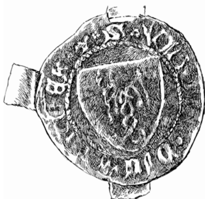
Obr. 6. Pečeť malostranského sladovníka Oldřicha Queka z roku 1367 (NA ŘM, inv. č. 2225; kresba O. Šefců, 2018).