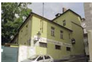
Obr. 5. Praha 1-Malá Strana, čp. 555, Tržiště 23, Všebaráčnická rychta. Celkový pohled (foto H. Tomagová 2016).

výsuvných křídel. Jedná se o zajištění z boku křídla, s pohyblivou částí mechanismu připevněnou na spodních rohovnících a s pevnou zarážkou na sloupku v úrovni poutce.