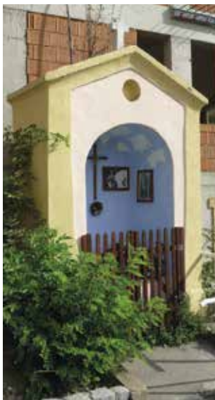
Obr. 3. Praha 8-Libeň, výklenková kaple u křížení ulic Stejskalova, U Rokytky. Pohled od jihozápadu (foto J. Baláček, 2017).

kříž. Průčelí je lemováno jednoduchým lizénovým rámcem, který pod štítem volně přechází do římsy. Výklenek je opatřen nízkými laťovými dřevěnými vrátky. Přístup ke kapličce doplňuje mladší betonové schodiště s jednoduchým kovovým trubkovým zábradlím.