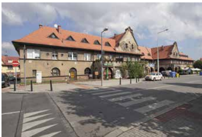
Obr. 2. Praha 6-Střešovice, čp. 250, Ústřední dům Ořechovka. Pohled od jihozápadu z ulice Na Ořechovce.

Rozlehlý polyfunkční objekt je složený ze dvou symetrických částí na obdélném půdorysu, uprostřed propojených užším krčkem. Dům je jednopatrový, zastřešený sedlovou střechou s valbou, prosvětlenou řadou malých vikýřů. Střed budovy zdůrazňuje dvojice štítů. Spojovací krček je v přízemí otevřený sloupovou síní, která plynule přechází do podloubí obíhající podél jižní fasády přibližně do její poloviny. V pravé části objektu je podloubí stále zachované, v levé části jsou oblouky loubí s výjimkou prvního pole dodatečně zazděné a uzavřené výkladci současné prodejny. Podloubí je v úrovni prvního patra ukončeno průběžnou terasou, která rovněž obíhá podél jižního průčelí. Severní průčelí má půdorysně podobný prvek, namísto podloubí je tu však jednopodlažní rizalit ukončený opět průběžnou terasou s plným zábradlím. Jednotlivé oblouky loubí na hranolových pilířích mají v ploše naznačený pilastr