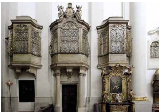
Obr. 2. Praha 1-Malá Strana, kostel sv. Tomáše. Pohled na arkýře a okna oratoří v jižní stěně presbytáře.

V kostele sv. Tomáše se dochoval pozoruhodný soubor oken oratoří různých typů, ovšem pocházejících z jediné stavební etapy. Nacházíme zde nevelká otočně otvíravá okna osazená v síle zdi a především početný soubor arkýřových oken dvou typů. Ty se odlišují konvexním či konkávním provedením bočních částí a provedením nadpraží střední části. Okenní výplně jsou provedeny tak, že za pevná křídla horní poloviny se vysouvají křídla spodní. Úprava oken oratoří v kostele sv. Tomáše, při níž vznikly námi sledované barokní výplně včetně výsuvných křidel, je datována do doby kolem roku 1730. Mechanismus zajištění výsuvných křidel je viditelný, jeho pohyblivé části jsou připevněny ke spodním rohovníkům