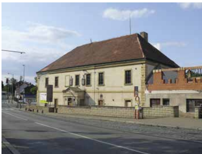
Obr. 5. Praha 9-Dolní Počernice, čp. 38, hostinec Barborka. Pohled z Českobrodské ulice (foto J. Baláček, 2017).

Areál bývalého zájezdního hostince Barborka je situován jihozápadně od historického jádra obce, při hlavní silnici a poblíž železniční trati. Počátky bývalého hostince Barborka spadají pravděpodobně již do 16. století. Současná podoba pochází ze století osmnáctého s úpravami v 19. a 20. století, přičemž je pravděpodobně dochování i starších konstrukcí. Historie areálu je úzce spjata s rozvojem silniční a poštovní sítě v 18. století. V místě je písemně doložena krčma se šenkem piva ve druhé polovině 16. století. Počátky zájezdního hostince a přeprahací stanice lze předpokládat již po roce 1736. Do druhé poloviny 18. století pravděpodobně spadá i výstavba dodnes dochovaných hmot hostince, v souvislosti s tereziánskou úpravou a novým trasováním