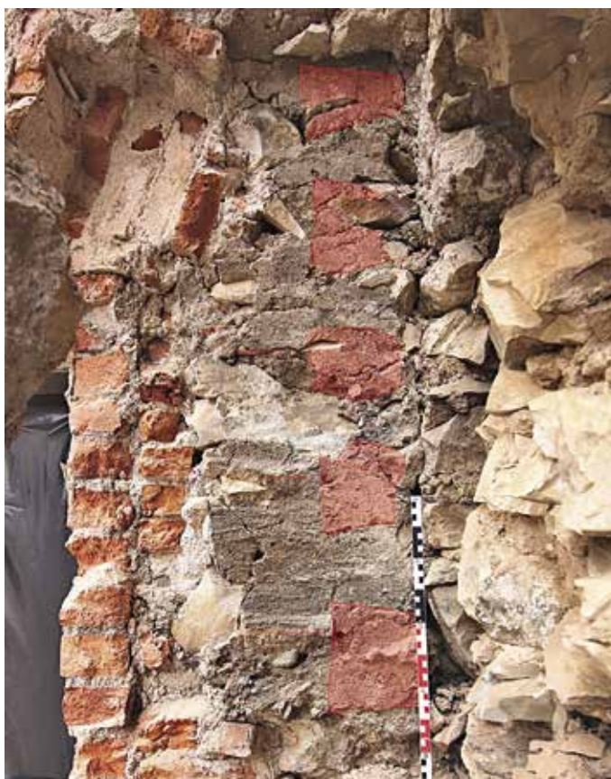
Obr. 7. Praha 1-Nové Město, čp. 30, Jungmannova 21. Otisk vazby nároží zaniklého středověkého srubu. Otisky čel trámů kolmých k průčelí zvýrazněny.

obou domů od středověku po současnost. Nejcennější nález představoval otisk nárožní vazby gotického srubu, zachovaný v jihovýchodním koutě přízemí. Pozorovány byly otisky čel pěti trámů roubení s charakteristickým tvarem rybinového spoje. Zeď sousedního čp. 29 byla v přízemí vylehčena dvojicí rozměrných oblouků – arkádou, na níž se dochovalo množství historických vrstev barevných nátěrů předpokládaného stáří od pozdní gotiky až po klasicismus. Na této zdi bylo možno zachytit řadu otisků dřevěných trámů, ne všechny nálezy však bylo možné interpretovat vzhledem k jejich torzovitosti. Ve vyšších úrovních byly nápadné především otisky starších střech domu čp. 30 z dob, kdy měl jen jedno patro, resp. dvě patra (obr. 7).