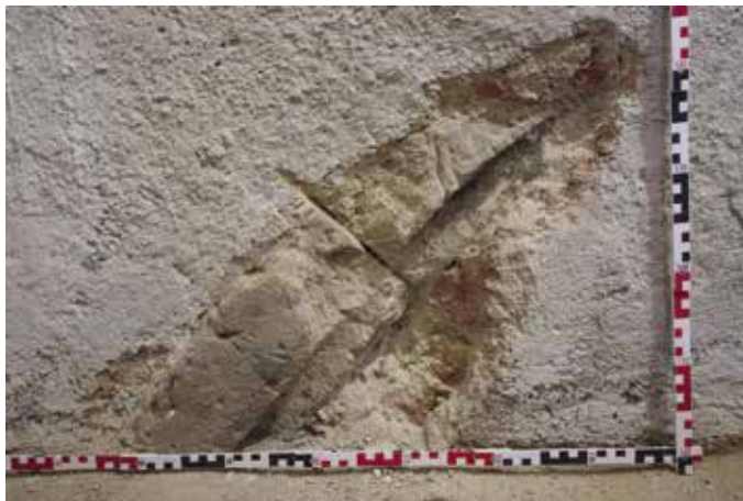
Obr. 13. Praha 2-Nové Město, kostel Panny Marie sv. Karla Velikého na Karlově. Pohled na nalezené gotické pískovcové články ve východní zdi pod podlahou zvonice (foto L. Bartoš, 2016).

V rámci přípravy osazení nových karlovských zvonů byla odstraněna ocelová zvonová stolice z 30. let 20. století a rozebrána podlaha zvonice. Pod podlahou byl učiněn zajímavý nález v severní části východní zdi věže. Objevily se zde části dvou pískovcových profilovaných článků, tvořící součást nejspíše rozměrnějšího lomeného oblouku. Prvky jsou profilovány výžlabkem, přecházejícím v navazující špatně čitelnou drobnou profilaci, odsazenou od kolmé plochy drobným zářezem či výžlabkem. Prvky jsou poškozeny odsekáním lícové plochy, předstupující před zdivo. Patrné je také poškození požárem. Nález je možné interpretovat snad jako část přístěnného klenebního žebra, vloženého sem v rámci stavební přípravy zaklenutí věže, ke kterému však před raným barokem nejspíše nedošlo (obr. 13).