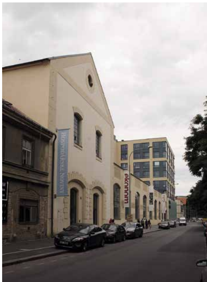
Obr. 4. Praha 8-Karlín, čp. 673, Hala Breitfeld-Daněk. Pohled od jihozápadu z Pernerovy ulice (foto M. Kracík, 2017).

Firma se specializovala na stavbu parních strojů a kotlů, dodávala těžní zařízení pro doly a stroje pro cukrovary, lihovary a pivovary. Prosperující Daňkovy strojírny postupem času zabíraly i okolní činžovní domy, které většinou ustoupily novým továrním halám, nebo byly pro jejich potřeby přizpůsobeny. V 90. letech 19. století, jak ukazuje dobový Hurtigův polohopisný plán, zabíraly tovární budovy a haly rozlehlé plochy v blocích mezi dnešní Křížickou, Šaldovou, Pernerovou a Kollárovou ulicí, rovněž dnes již zbořené objekty na protější