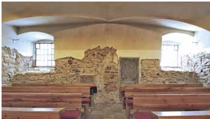
Obr. 6. Praha 1- Nové Město, kostel sv. Michala v Jirchářích. Nález původního středověkého vstupu do věže v podkruchtí.

byla původně výše než dnešní a než úroveň střední a severní lodi. Zajímavé nálezové situace byly zachyceny především na jižní zdi jižní boční lodi a na dělicí zdi mezi střední a severní lodí (obr. 6).