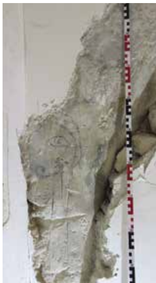
Obr. 8. Praha 1-Nové Město, čp. 753, františkánský klášter. Část nalezeného gotického portálu v JV koutu ambitu.