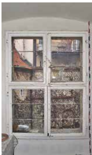
Obr. 3. Praha 1-Malá Strana, čp. 163, Valdštejnské náměstí 2. Pohled na okno ze schodiště.