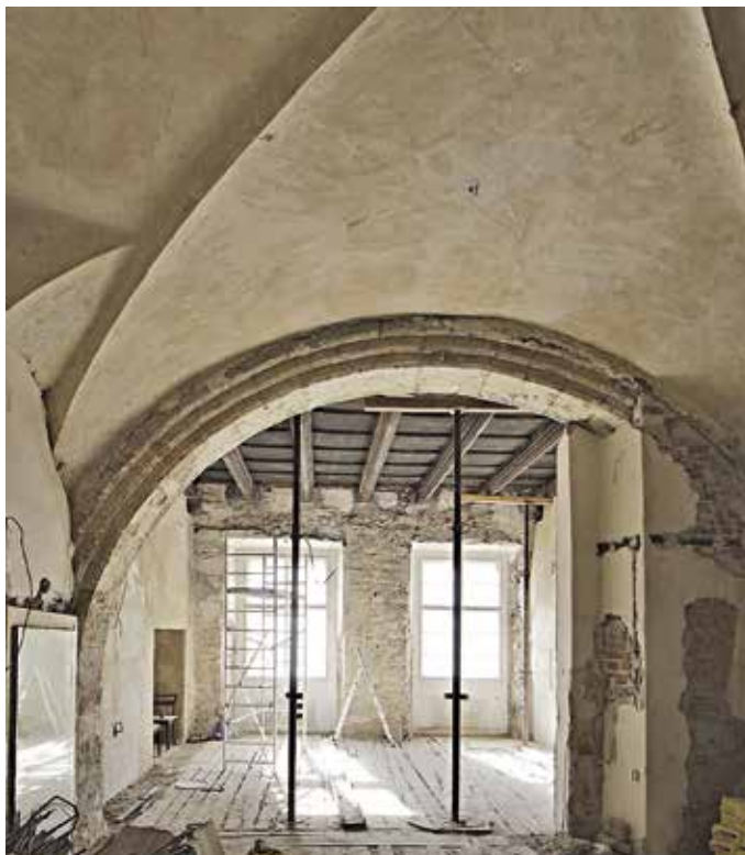
Obr. 12. Praha 1-Staré Město, čp. 510, Havelská 5, dům u Brunčvíka. První patro, místnosti 102 a 103. Průhled někdejší velkou síní s velkým gotickým profilovaným pasem v průběhu renovace předního bytu.

Od 14. století (stavební etapa vybudování honosného vrcholně gotického domu s loubím datujeme podle nalezeného stropního trámu do poloviny 30. let 14. století) až do současnosti musela být v trojtraktovém objektu dosti složitě řešena problematika osvětlení středního traktu a severozápadního dílu (sousedícího s bočním křídlem) předního domu.