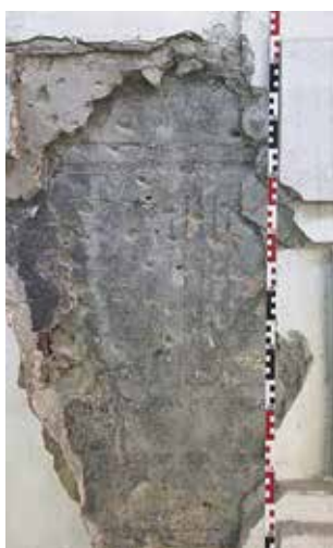
Obr. 4. Praha 1- Malá Strana, čp. 205, Nerudova 2, Zámecká 1. Odhalená část sgrafitové fasády při severním konci východní fasády.