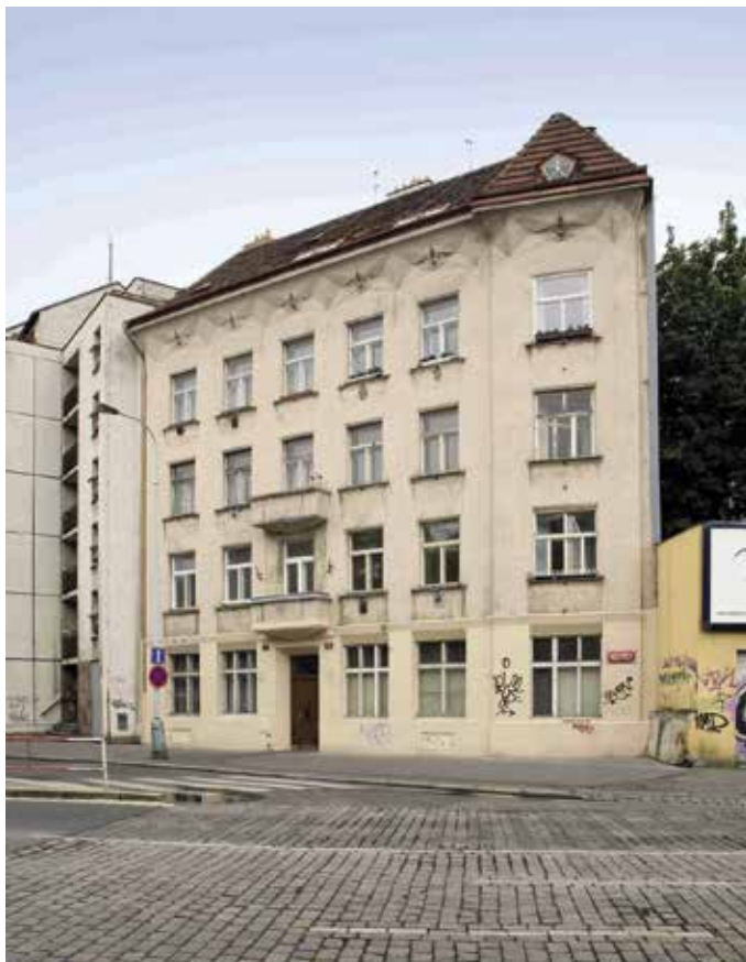
Obr. 1. Praha 2-Vyšehrad, čp. 56, nájemní dům. Pohled od severu (foto P. Havlík, 2013).

Třípatrová budova na nepravidelném lichoběžníkovém půdorysu má sedlovou střechu. Kubisticky pojednaná uliční fasáda je celkem šestiosá, přičemž pravá krajní osa mělkého rizalitu se od hlavní fasády poněkud odklání a sleduje zalomení uliční čáry. Fasáda je členěná řadou kubistických motivů, zvláště formovaných do tupouhých břítů, užitých na kordonové římsě, balkonech, meziokenních pilířích či na korunní římsě s vysokým vlysovým pásem s hvězdicovým motivem. Specifický prvek představovaly původně otevřené loggie v každém patře rizalitu. Dvorní průčelí je řešeno