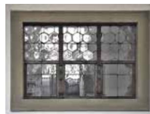
Obr. 1. Praha 1-Hradčany, kostel Panny Marie Andělské. Pohled na okno oratoře z lodi kostela.

Kapucínský kostel Panny Marie Andělské na Hradčanech v sobě ukrývá unikátní soubor výplňových prvků z doby výstavby tohoto kostela a následujícího období necelých 100 let. Pro dokumentaci bylo zvoleno jedno ze dvou shodně řešených dubových oken (obr. 1) nacházejících se v úrovni prvního patra ve východně stěně hlavní lodi, která je prolomena dvěma ležatě obdélnými okenními otvory. Detailně dokumentováno bylo okno nacházející se blíže ke kapli sv. Kříže. Předmětné výplňové prvky by podle stavební historie i použitého kování měly svou dataci náležet k přestavbě kostela v 60. letech 17. století. Je zřejmé, že kompletně dochovaný soubor kování vychází ještě z pozdně renesanční estetiky. Zajímavostí oken je fakt, že dřevěné okno včetně rámu lze pomocí jednoduchého mechanismu vysadit z pískovcového ostění a otvor tak ponechat bez výplně. Byla zdokumentována také profilace sloupků obrácených do lodi, které jsou zvýrazněny bohatou řezbou – dvě proti sobě stáčené konzolky s penízky. Také zasklení dokumentovaných oken je historické, horní tři pevná pole jsou zasklena šestiúhelníky do olova, zasklení je ztuženo železnými nosníčky do kříže. Každé spodní křídlo je pak otevíratelné pomocí speciálního pružinového mechanismu, který je opatřen okosenou plechovou západkou a je připevněn k vertikální části spodního rohovníku. Při vysunutí křídla se západka opře o zarážku, která je osazena na sloupcích v úrovni poutce a je stejně jako rohovníky zvýrazněna trojlistem.