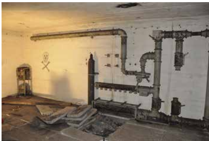
Obr. 7. Kryt na ppč. 144, Praha 6-Bubeneč. Hlavní prostor krytu se vzduchotechnikou. Vpravo filtrační zařízení, vlevo v rohu zásobník na filtry.