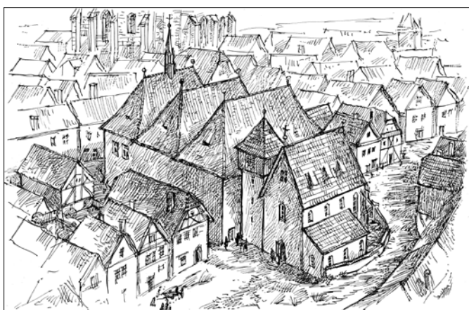
Rekonstrukce původní podoby kaple

Perozkresba, provedená podle architektonického modelu, přibližuje hypotetickou „původní“ podobu Betlémské kaple (tedy z doby, kdy zde kázal Jan Hus). Pohled je veden od jihozápadu, z kaple je zejména patrné západní průčelí. Jižní průčelí, které dnes lemují Betlémské náměstí, zde téměř úplně překrývá románsko-gotický kostel sv. Filipa a Jakuba. Polohu kostela vůči Betlémské kapli dokládá zaměření jeho základů provedené v rámci archeologických průzkumů. Existence tohoto kostela, který zanikl patrně během husitských válek, mohla mít významný vliv na úpravu jižního průčelí kaple, orientaci jejích střech, provedení štítů apod. Model byl zhotoven pro potřeby výstavy Praha Husova a husitská v dílně Petra Dvořáka a na základě odborných konzultací s Otou Halamou, Janem Hrdinou a Jaroslavem Podliskou.