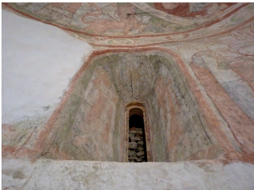
Obr. 4. Praha-Hostivař, kostel Stětí sv. Jana Křtitele. Pohled na odkryté severní okno z interiéru (foto L. Bartoš, III/2010).

Při vlastním ostění jsou pruhy propojeny průběžným prvkem, rámuujícím okno. Podobný rámuující pruh lemoval i vnější hranu špalet. Místy je kámen opatřen jen vápennou malbou, jinde je pod ní ještě podkladní vrstva tenké vápenné omítky, sloužící zřejmě pro vyrovnání podkladu. Tato původní povrchová vrstva byla překryta mladší omítkou, která rovněž zabíhala do špalety. I tato omítka mohla pocházet ze středověké, případně z raně novověké etapy vývoje kostela. Její povrch byl opatřen bílým vápenným nátěrem a při pozdějších opravách zdrsněn pekovaním.