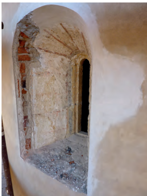
Obr. 3. Praha-Hostivař, kostel Stětí sv. Jana Křtitele. Pohled na odkryté severní okno z exteriéru (foto L. Bartoš, X/2010).