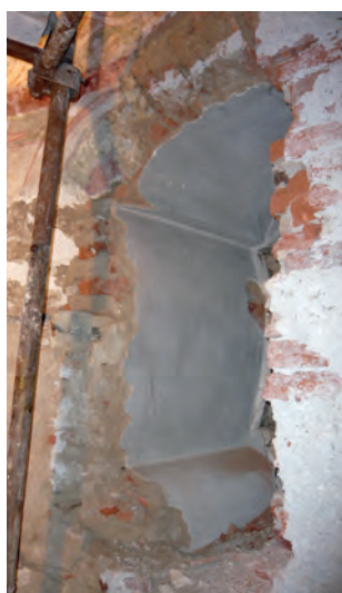
Obr. 5. Praha-Hostivař, kostel Stětí sv. Jana Křtitele. Pohled na nálezovou situaci jižního okna z interiéru. Nahoře část záklenku románského okna, zakomponovaná do celku maleb, vlevo malby porušující špaletu gotického okna, vpravo barokní kasulové okno, zcela vpravo zazdívká kasule z roku 1893.

Plocha vnitřních špalet je součástí souboru figurálních nástěnných maleb apsidy. Po stranách okna lemují postavy svatých Petra a Pavla (ROYT 2010). Ve vrcholu špalety je umístěna velká hvězda (obr. 4). Vpravo stál sv. Petr s charakteristickým účesem v podobě kratších vlnitých vlasů, proti němu sv. Pavel s protaženým obličejem (VŠETEČKOVÁ 2010). Hrana špalety je zvýrazněna červeným pruhem, lemovaným bílými pásky. Omítka, na které byly malby provedeny, vykazuje výrazné nepravidlosti. V záklenku tak dodnes můžeme pozorovat otisky prken bednění, podobně jako v konše apsidy.