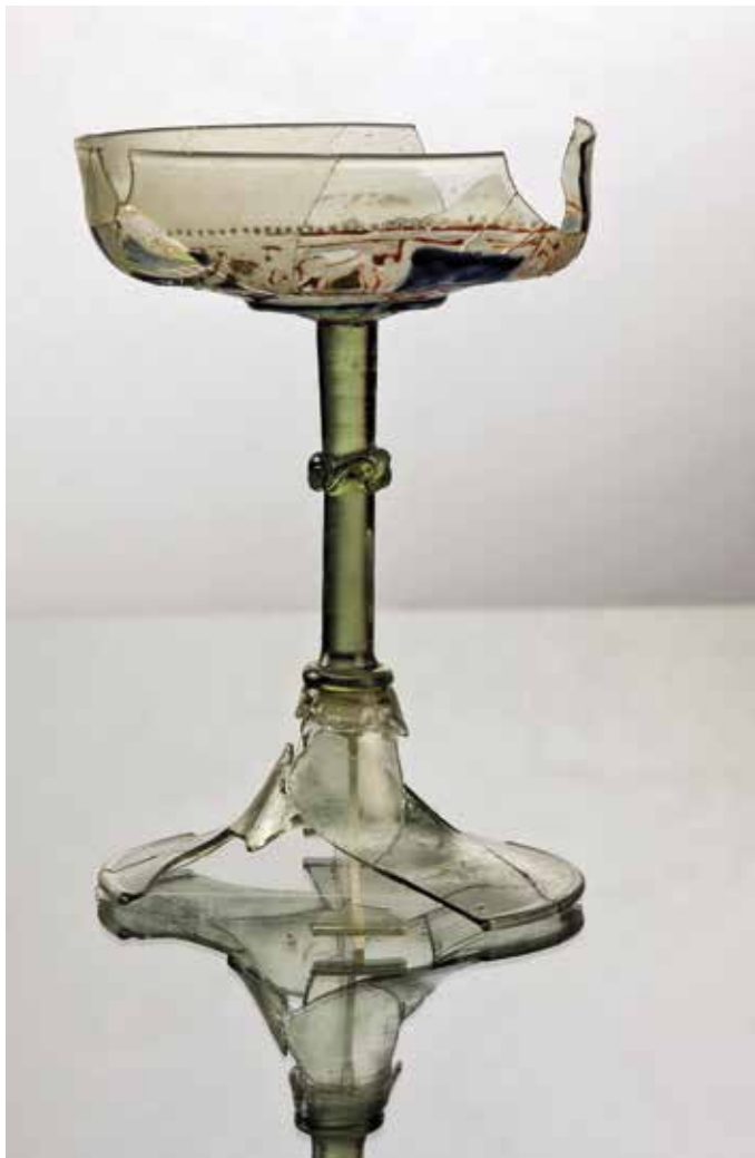
Obr. 2. Praha 1-Staré Město. Na Můstku čp. 379+380/I. Pohár malovaný zlatem a emaily z 2. poloviny 13. století či 1. poloviny 14. století.

Další skupinu nálezů představovaly lahvovité tvary, objevující se v minimálně třech exemplářích. Z výrazně fragmentárně dochovaného materiálu bylo možné rekonstruovat torzo lahve s vertikálně natavenými žebry (ČERNÁ 1994, 53–54; ŽĎÁRSKÁ 2014, 28, obr. 10a). Čiré sklo s růžovohnědým nádechem bylo překvapivě málo postiženo korozi. Ze stejného kontextu pocházejí také zlomky menší lahvovité nádoby s výrazně klenutými stěnami a obdobnou výzdobou i zabarvením skloviny. Vzhledem k charakteru obou předmětů lze předpokládat, že se jednalo o výrobky cizích skláren, jejich bližší lokalizaci neznáme. Srovnatelný nález datovaný do období kolem poloviny 13. století s širokým nízkým tělem zdobeným řídkým plastickým žebrováním známe z Brna, Kozí ulice. 5 Vzhledem k ojedinělosti nálezu v českých zemích jej Z. Himmelová spojovala s oblastí Porýní či severní Itálie (HIMMELOVÁ 1991, 14). Další obdobně datovaný exemplář je v současnosti