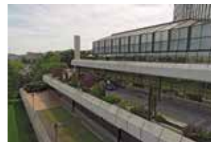
Obr. 32. Praha 4-Nusle, čp. 1655, Kongresová 1. Někdejší hotel Forum, exteriér, podnož hotelu s terasami obrácenými do Nuselského údolí (foto M. Kracík, 2013).

Hotel sestává z horizontální, částečně do terénu zapuštěné hmoty podnože s terasami (obr. 32) a dominantní vertikální lůžkové části (obr. 33). Budova stojí při terénní hraně, čehož autor využil k návrhu teras v podzemních podlažích. Jak architekt vysvětloval (TRÁVNÍČEK 1984, 315), bylo