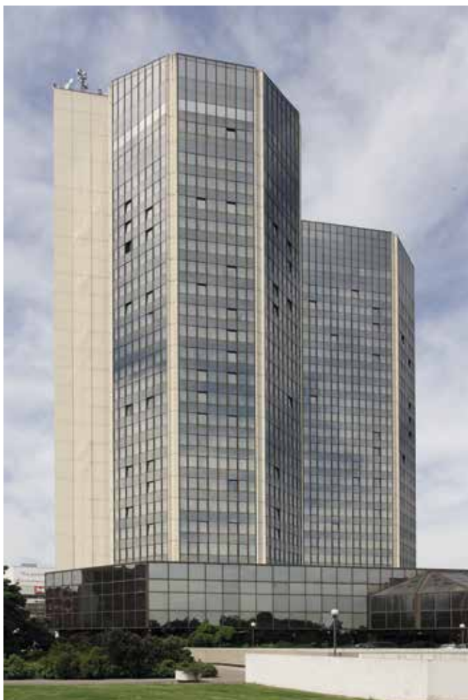
Obr. 33. Praha 4-Nusle, čp. 1655, Kongresová 1. Někdejší hotel Forum, exteriér, západní fasáda lůžkové části.