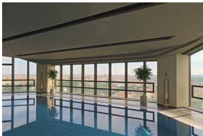
Obr. 40. Praha 4-Nusle, čp. 1655, Kongresová 1. Někdejší hotel Forum, interiér bazénu v nejvyšším podlaží, původní dynamický modrobílý pohled byl nahrazen konvenčním rovným.

fie (obr. 39). Design interiéru zde, na rozdíl od ostatních prostor, ovládaly oblé tvary barů a podhledu. Osvětlovací tělesa, navržená Pavlem Hlavou, v průběhu večera měnila svou barvu díky barevným reflektorům řízených počítačem. Lůžková část zabírá 20 pater a převážně se jedná o dvoulůžkové pokoje, jejichž prostor tvoří výseč osmibokého hranolu rozšiřující se směrem k oknu. V pokojích se, na rozdíl od zbytku