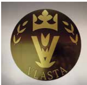
Obr. 25. Praha 1-Staré Město, čp. 43, Pařížská 30. Hotel Intercontinental, piktogram nade dveřmi do salonku Vlasta, návrh Jiří Rathouský (foto K. Houšková, 2013).

a struktury), Josef Jíra (malované vitráže), Jiří Rathouský (grafika, piktogramy; obr. 25). Výčet ale zdaleka není úplný, pouze výběrový. Zastoupena byla také řada dalších bezejmenných výtvarníků z institucí typu zmíněného ÚBOKu. 33