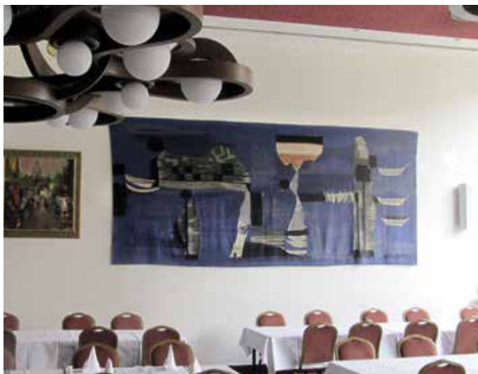
Obr. 6. Praha 7-Holešovice, čp. 1502, Veletržní 20. Parkhotel, interiér po úpravě v 90. letech 20. století, tapisérie Věry Drnkové Zářecké (foto K. Houšková, 2013).