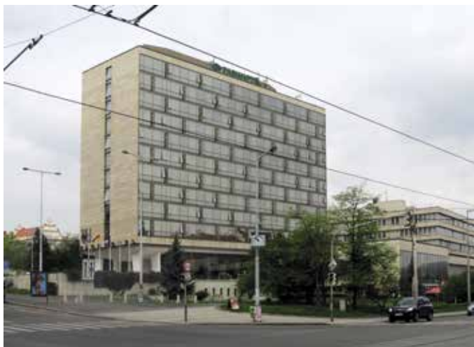
Obr. 1. Praha 7-Holešovice, čp. 1502, Veletržní 20. Parkhotel, exteriér, pohled z ulice Dukelských hrdinů.

Podrobný článek (KLIMEŠ 1968) vydaný v roce 1968, tedy krátce po dokončení hotelu, po zevrubném popisu hodnotí objekt kladně a nevyhýbá se srovnání se staršími poválečnými pražskými hotely (Jalta, Internacional, Solidarita), které označuje jako svědectví doby, dávající „možnost s určitým odstupem a srovnáváním posoudit, do jaké míry se staly např. v dispozici, v architektuře interiérů atd. poučením pro další výstavbu těchto zařízení u nás.“ Parkhotel, označený jako první dokončený hotel další etapy výstavby těchto zařízení v hlavním městě, hodnotí Vlastibor