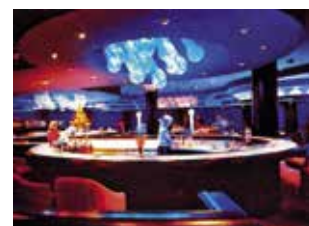
Obr. 39. Praha 4-Nusle, čp. 1655, Kongresová 1. Někdejší hotel Forum, interiér nočního klubu „Galaxie“, původní stav, dnes neexistuje.

fie (obr. 39). Design interiéru zde, na rozdíl od ostatních prostor, ovládaly oblé tvary barů a podhledu. Osvětlovací tělesa, navržená Pavlem Hlavou, v průběhu večera měnila svou barvu díky barevným reflektorům řízených počítačem. Lůžková část zabírá 20 pater a převážně se jedná o dvoulůžkové pokoje, jejichž prostor tvoří výseč osmibokého hranolu rozšiřující se směrem k oknu. V pokojích se, na rozdíl od zbytku