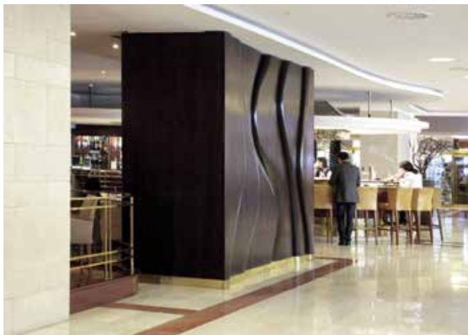
Obr. 29. Praha 1-Staré Město, čp. 43, Pařížská 30. Hotel Intercontinental, dřevěná stěna – paraván, návrh Josef Klimeš, interiér „lounge“ a baru ateliér Len + K.

Důležité je připomenout letmo zmíněnou spolupráci s tehdejšími výtvarnými institucemi, především již uvedeným ÚBOK, Krásnou jizbou provozovanou při Ústředí lidové umělecké výroby nebo Institutem průmyslového tvarování (později designu). Zejména ÚBOK se podílel především na výběru a návrzích textilních doplňků (tapety, koberce, závěsy, uniformy zaměstnanců) a dále jídelních a nápojových servisů (keramika, porcelán, sklo) lišících se podle funkce jednotlivých prostor.