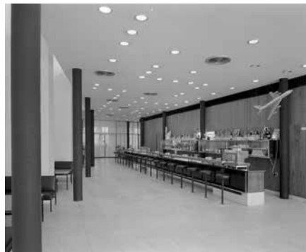
Obr. 2. Praha 7-Holešovice, čp. 1502, Veletržní 20. Parkhotel, původní interiér restaurace, v pozadí tapisérie Jana Hladíka.