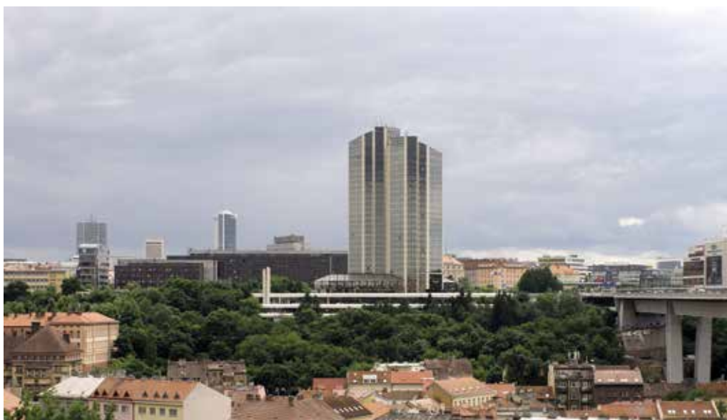
Obr. 31. Praha 4-Nusle, čp. 1655, Kongresová 1. Někdejší hotel Forum, exteriér, pohled z Karlova.

Hotel Forum, tehdy ještě Kosmos, se v literatuře objevuje již v roce 1984, kdy byla publikována vnitroustavní architektonická soutěž VPÚ z roku 1982, kterou vyhrál návrh Jaroslava Trávníčka z ateliéru 7. „Kompozičně bude stavba hotelu plnit funkci úměrného vertikálního prvku, který spolu s horizontálou Paláce kultury a mostu Klementa Gottwalda vytvoří základní architektonický obraz pankráckého předmostí. Toto nové urbanistické přeskupení v panoramatickém obrazu města vytvoří úvod k nové zástavbě Pankrácké pláně s výškovým vyvrcholením v místech Centrálního náměstí.“ (TRÁVNÍČEK 1984, 315).