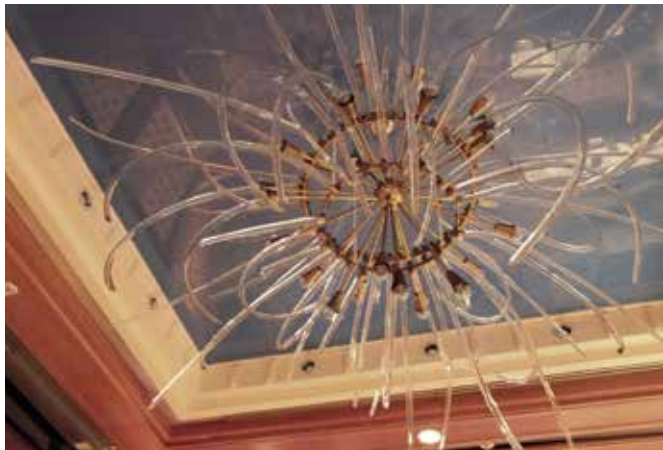
Obr. 22. Praha 1-Staré Město, čp. 43, Pařížská 30. Hotel Intercontinental, detail skleněného vlisu, návrh Stanislav Libenský, Kongresový sál, předsálí (foto K. Houšková, 2013).