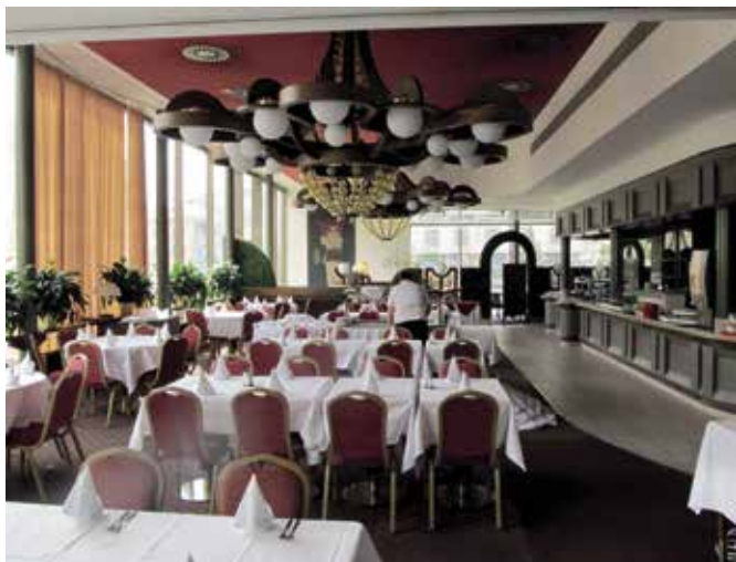
Obr. 9. Praha 7-Holešovice, čp. 1502, Veletřní 20. Parkhotel, interiér restaurace po úpravě v 90. letech 20. století, v pozadí tapisérie Věry Drnkové Zářecké.