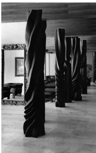
Obr. 28. Praha 1-Staré Město, čp. 43, Pařížská 30. Hotel Intercontinental, dobová fotografie, interiér chodby u Loveckých salonků, prostor s betonovými překlady a dřevěnými sloupy sochaře M. Hejného v kontrastu historických zrcadel a nábytku (foto archiv hotelu, 70. léta).

umístěny druhotně a jen pohled na starší fotografie napoví, jak působivé toto dílo bylo původně. Řada těchto sloupů tvořila fascinující „stromořadí“ v koridoru podél tzv. „Loveckých salonků“ (dodnes zachovalých prostor napravo od recepcce, byť bez původní výzdoby) a spolu s nimi a dalšími tematickými díly představovala lesní a přírodní bohatství tehdejšího Československa (HOFFMANN 1974, 22, obr. 28). 34