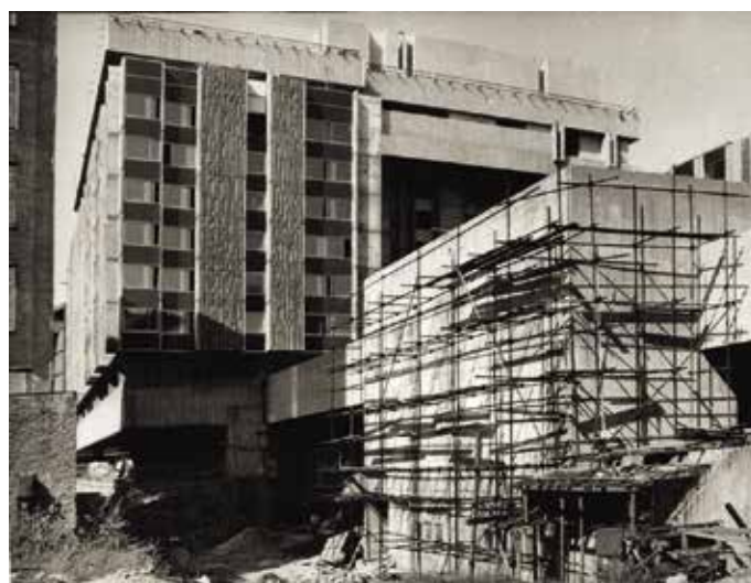
Obr. 12. Praha 1-Staré Město, čp. 43, Pařížská 30. Hotel Intercontinental, dobová fotografie z výstavby hotelu, fasádu člení vertikální pásy keramického obkladu.