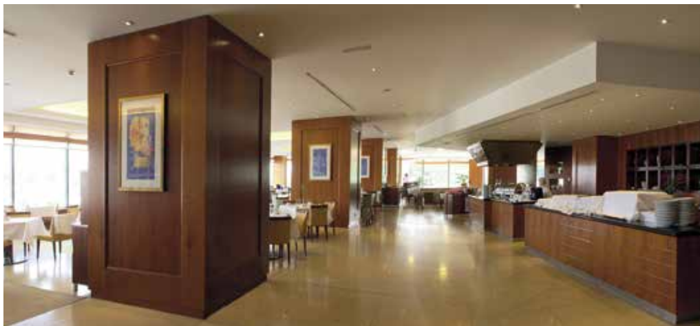
Obr. 38. Praha 4-Nusle, čp. 1655, Kongresová 1. Někdejší Hotel Forum, interiér restaurace v přízemí, po přestavbě.