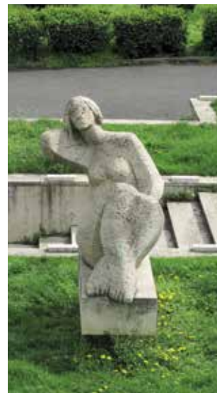
Obr. 7. Praha 7-Holešovice, čp. 1502, Veletřní 20. Parkhotel, socha od Václava Bejčka v zahradě před hotelem.