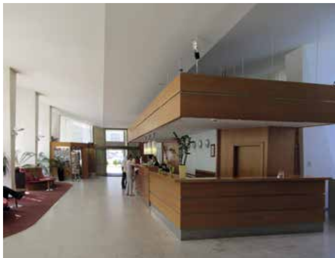
Obr. 10. Praha 7-Holešovice, čp. 1502, Veletřní 20. Parkhotel, interiér vstupní části s recepcí po úpravě v 90. letech 20. století.

ale ani ubytovací části, v podstatě nic. Jasně uspořádání zvýšeného přízemí bylo místy narušeno příčkami, zakryto bylo prosvětlení střední komunikační partie horními okny. Záměrem současného uživatele nicméně je návrat k původnímu pojetí společenských prostor. Úpravy jsou navrhovány za účasti autorky původních interiérů a na rozdíl od dobového řešení jsou do prostor zakomponována nová výtvarná díla a volný nábytek stylově odpovídající době postavení hotelu. Společenské a restaurační prostory by měly být postupně rehabilitovány během roku 2014. 19