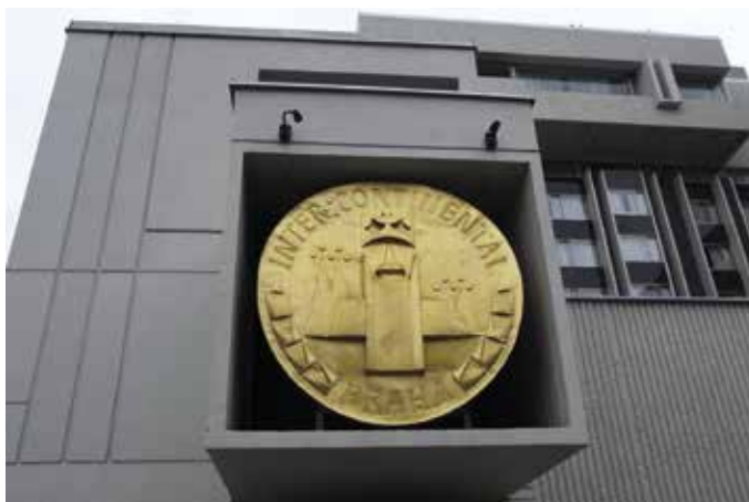
Obr. 30. Praha 1-Staré Město, čp. 43, Pařížská 30. Hotel Intercontinental, předsazený emblém hotelu na západní straně fasády od Pařížské ulice, kopie.

Do dnešní doby zůstala zachována architektura stavby, hmota i její obvodový plášť. Interiéry ale prošly podstatnými změnami. Ačkoliv se architekti z ateliéru Len + K, 37 autoři většiny rekonstrukcí od počátku 90. let do roku 2012, snažili ctít a respektovat styl práce původních autorů, Filsakova a Šrámkova týmu, řada uměleckého vybavení a zařízení prostor zcela zmizela již v průběhu raných 90. let, kdy hotel procházel divokými vlastnickými změnami. Řada artefaktů zůstala, ale byla přemístěna na jiné místo (např. část Hejného dřevěných sloupů). Tehdejší komplexně řešené interiéry mají dnes jinou podobu nebo jako prostory s určitou funkcí zmizely úplně (noční klub, vinnárna, snack bar). Z nejprestižnější skleněné výzdoby zůstaly jen napevno instalované vitráže (Josef Jíra), skulpturální skleněné výplně (Stanislav Libenský) a některá stropní svítidla (René Roubíček, Jiří Novák). I přes provedené změny a úpravy je architektura stavby a urbanistické řešení okolí stále velmi silným počinem a řešením natolik výrazným, že si zaslouží nejen pozornost, ale v lepším případě i nějakou míru státem garantované ochrany. Interiéry, ač přizpůsobené dnešní estetice (a samozřejmě jejím požadavkům), nejsou již obrazem původního řešení, ale pracují s prostorem tak, aby navazoval na architekturu exteriéru a řada původních děl je do nich stále zakomponována. Z tohoto hlediska by bylo žádoucí zvážit návrh hotelu Intercontinental za kulturní památku.