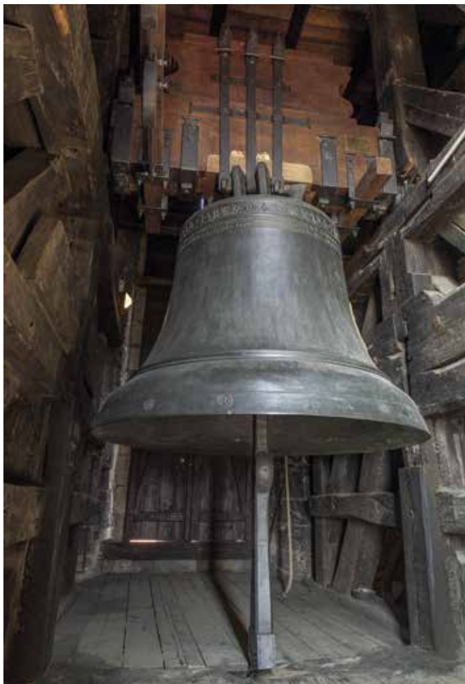
Obr. 1. Praha 1-Staré Město, kostel Matky Boží před Týnem. Zvon Maria, Tomáš Jaroš, 1553.

všechny staroměstské zvony, jak ho dnes slyšíme my, stejně slýchaly i před námi řady generací. Ve svých Pamětech se o zvonu zmiňuje i Mikuláš Dačický z Heslova: „Zvon hlasu dobrého vtažen a zavěšen v tejské věži v Staré Praze.“ 5 Zvon Maria je po svatovítském Zikmundu od téhož zvonaře druhým největším zvonem v Praze. Ve spodním průměru měří 205 cm a má hmotnost 6450 kg. Zvon má korunu se šesti uchy a je zavěšen v původní dubové zvonové stolici. Hlavní tón zvonu je a 0 (obr. 1).