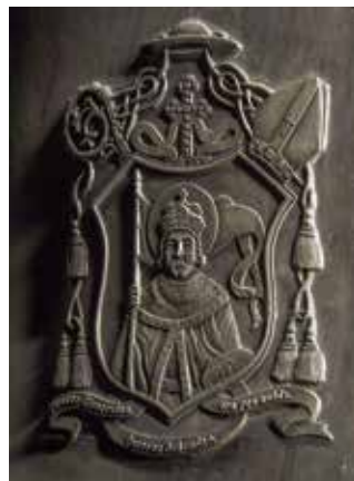
Obr. 26. Praha 1-Staré Město, kostel Matky Boží před Týnem. Zvon Archanděl Michael, Leticie Vránová Dytrychová, 2007, detail archanděla Michaela.