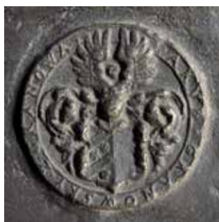
Obr. 9. Praha 1-Staré Město, kostel Matky Boží před Týnem. Zvon Maria, Tomáš Jaroš, 1553, medaile s erbem Jakuba Granovského z Granova.