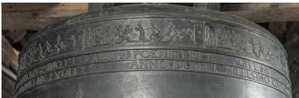
Obr. 2. Praha 1-Staré Město, kostel Matky Boží před Týnem. Zvon Maria, Tomáš Jaroš, 1553, detail výzdoby pod čepcem, motiv Vraždění betlémských neviňátek.

1. řádek: POENITENCIAM AGITE INSTAT ENIM REGNUM COELORVM MATHE TERCIO ET QVARTO*QVIS IN VOBIS EST TIMENS DOMINVM AVDIAT VOCEM SERVI EIVS ESAIE QVINQVAGESIMO ET CETERA*