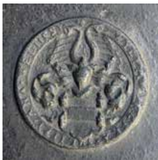
Obr. 5. Praha 1-Staré Město, kostel Matky Boží před Týnem. Zvon Maria, Tomáš Jaroš, 1553, medaile s erbem Viléma Trčky z Lípy a na Veliši (foto P. Havlík, 2013).