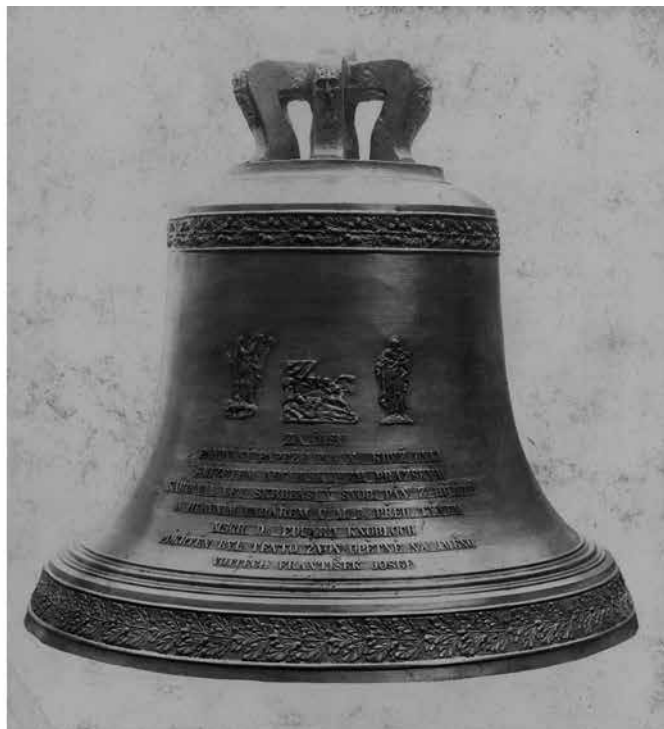
Obr. 17. Praha 1-Staré Město, kostel Matky Boží před Týnem. Zvon Vojtěch po přelítí, Arnošt Diepold, 1903.