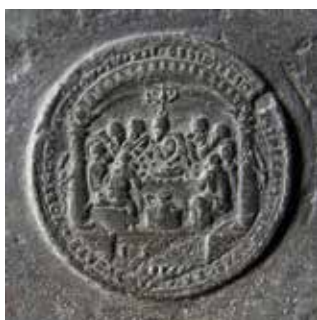
Obr. 8. Praha 1-Staré Město, kostel Matky Boží před Týnem. Zvon Maria, Tomáš Jaroš, 1553, medaile s námětem Poslední večeře.