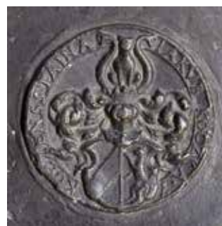
Obr. 10. Praha 1-Staré Město, kostel Matky Boží před Týnem. Zvon Maria, Tomáš Jaroš, 1553, medaile s erbem Jakuba Koczky z Kotzensteina.