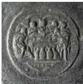
Obr. 6. Praha 1-Staré Město, kostel Matky Boží před Týnem. Zvon Maria, Tomáš Jaroš, 1553, medaile s námětem Svatby v Káni Galilejské (foto P. Havlík, 2013).