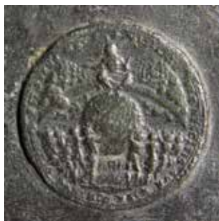
Obr. 12. Praha 1-Staré Město, kostel Matky Boží před Týnem. Zvon Maria, Tomáš Jaroš, 1553, medaile s námětem Posledního soudu.