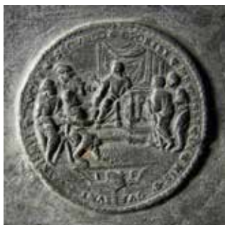
Obr. 11. Praha 1-Staré Město, kostel Matky Boží před Týnem. Zvon Maria, Tomáš Jaroš, 1553, medaile s námětem Dvanáctiletý Ježíš v chrámě.