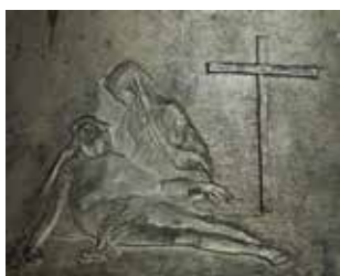
Obr. 21. Praha 1-Staré Město, kostel Matky Boží před Týnem. Zvon Pieta – Anežka, Petr Rudolf Manoušek, 1989, detail výzdoby pod čepcem (foto Přemysl Havlík, 2013).