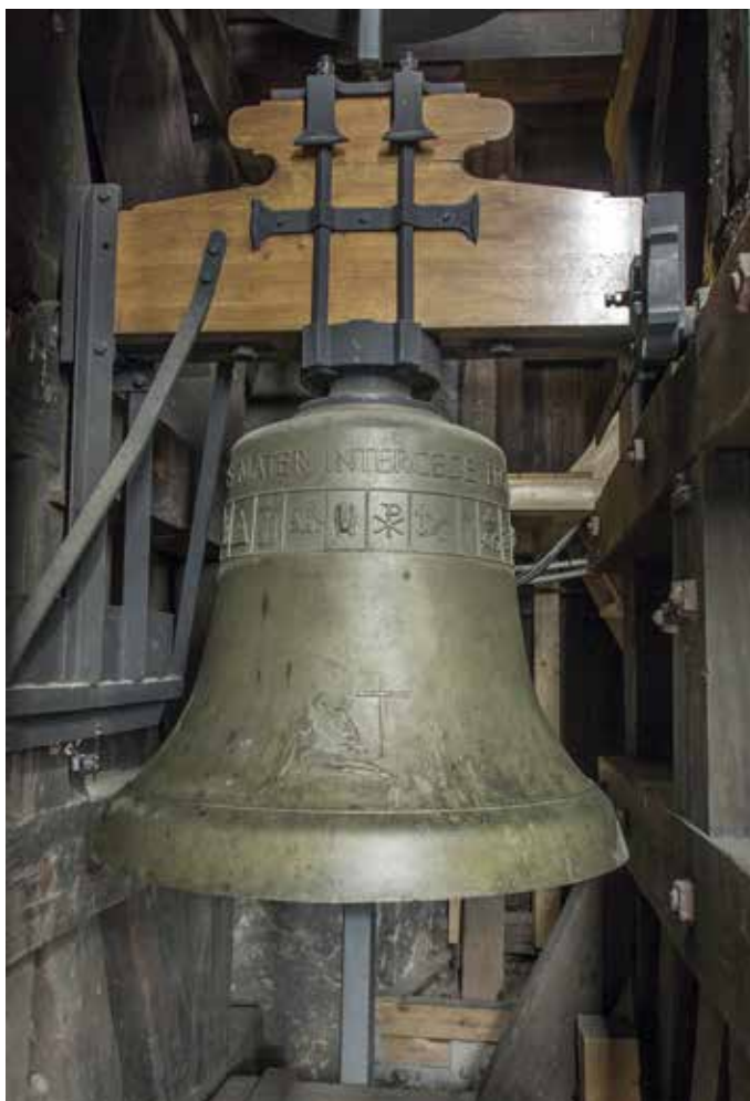
Obr. 20. Praha 1-Staré Město, kostel Matky Boží před Týnem. Zvon Pieta – Anežka, Petr Rudolf Manoušek, 1989, detail Piety s křížem.