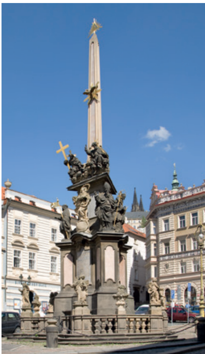
Obr. 5. Praha 1-Malá Strana, Malostranské náměstí. Morový sloup Nejsvětější Trojice, 1713–1715.

tyž 1906, 211–215). Později bylo jeho zábradlí obohaceno o pozdně barokní putti a vázy jako díkůvzdání za zmírnění hladomoru z roku 1772.