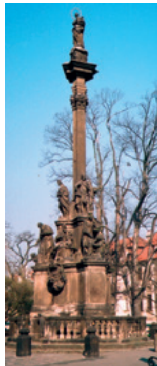
Obr. 4. Praha 1-Hradčany, Hradčanské náměstí. Morový sloup Panny Marie Neposkvrněné, 1724–1736.

Čtvrtým a nejmladším pražským mariánským sloupem je pískovcový sloup s Pannou Marií Neposkvrněnou v zahradě domu čp. 457 v Praze 14-Dolních Počernicích na rohu ulic Listopadové a Podkrkonošské. Jde o hladký, ve spodní třetině mírně rozšířený sloup na hranolovém podstavci s nápisem „Tento Obraz k pobožnému uctění Mariánským horlivým Ctitelům