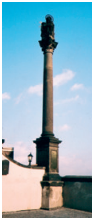
Obr. 3. Praha 1-Hradčany, hradní rampa. Sloup s Pietou, 1663.

Jen o třináct let mladší, ale stále existující a z tohoto hlediska nejstarší mariánský sloup v Praze, je sloup Panny Marie Bolestné (Pietu) na rampě u nynější kavárny Kajetánka na konci ulice Ke Hradu na Hradčanech (obr. 3). Vytvořil ho v roce 1663 neznámý umělec na pokyn nejvyššího purkrabího Bernarda Ignáce z Martinic. Prý proto, „aby šlechtici k úřadům na hradě hojně tudy se ubírající, jakož