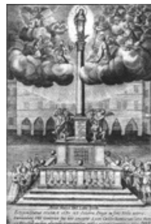
Obr. 1. Praha 1-Staré Město, Staroměstské náměstí. Mariánský sloup od Jana Jiřího Bendla z roku 1650, stržený v roce 1918, anonymní rytina z roku 1651 (z ŠORM/KRAJČA 1939, 9).