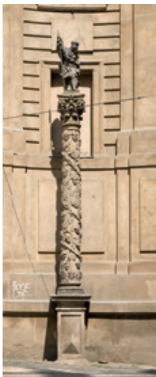
Obr. 7. Praha 1-Staré Město, u kostela sv. Františka. Sloup sv. Václava, Jan Jiří Bendl, 1676 (foto P. Havlík, 2012).