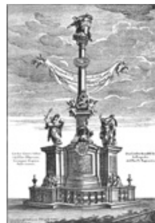
Obr. 6. Praha 1-Nové Město, Štěpánská ulice. Někdejší morový sloup Nejsvětější Trojice, 1714–1879?, rytina Antonína Birkharta, 1714? (z PODLAHA 1929, 158).

V Praze bylo v minulosti ještě jedno trojiční sousoší . Bylo postaveno po morové epidemii v roce 1713 o rok později na rohu ulic Štěpánské a V Jámě z podnětu a na náklad hraběte Františka Antonína Šporka (obr. 6). V roce 1834 bylo odtud přeneseno k severní straně blízkého kostela sv. Štěpána, ale při jeho opravách v letech 1874–1879 poškozeno a následně strženo (EKERT 1884, 95). Jeho podobu známe jen z dobové rytiny Antonína Birkharta podle kresby Jana Hiebela (PODLAHA 1929, 158). Podle ní díky s jónskou hlavicí nesl na vrcholu sochu Boha Otce s napřaženou pravíci, uprostřed holubici (symbol Ducha Svatého) a při patě na římsě hranolového soklu Madonu s dvěma andělky. U paty podstavce spočívala socha klečícího sv. Jana Nepomuckého, po stranách sochy sv. Rocha a archanděla Michaela. Spodní část sloupu tvořil vysoký podstavec se zaoblenou střední částí se sporckovským znakem a dvěma křídly, na kterých stály zmiňované obě boční sochy. Sloup byl obehnán balustrovým zábradlím s dvěma andělky a dvěma