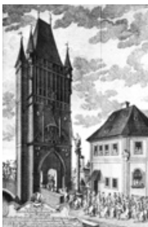
Obr. 8. Praha 1-Staré Město, Křižovnické náměstí. Sloup sv. Václava od Jan Jiřího Bendla z roku 1676 na původním místě při korunovačním průvodu Marie Terezie 11. května 1743. Rytina Martina Tyrofa podle kresby Jana Josefa Dietzlera (z RAMHOFSKY 1743; repro autor, 2011).

vázami. Na nejnižším stupni podstavce byl nápis udávající výšku sousoší na 20 loktů pražských, tj. téměř 12 m. Podle nápisu na vyobrazení sloupu ho zhotovil kameník F. W. Herstorffer a sochař J. G. Schlansoffskhij. 4