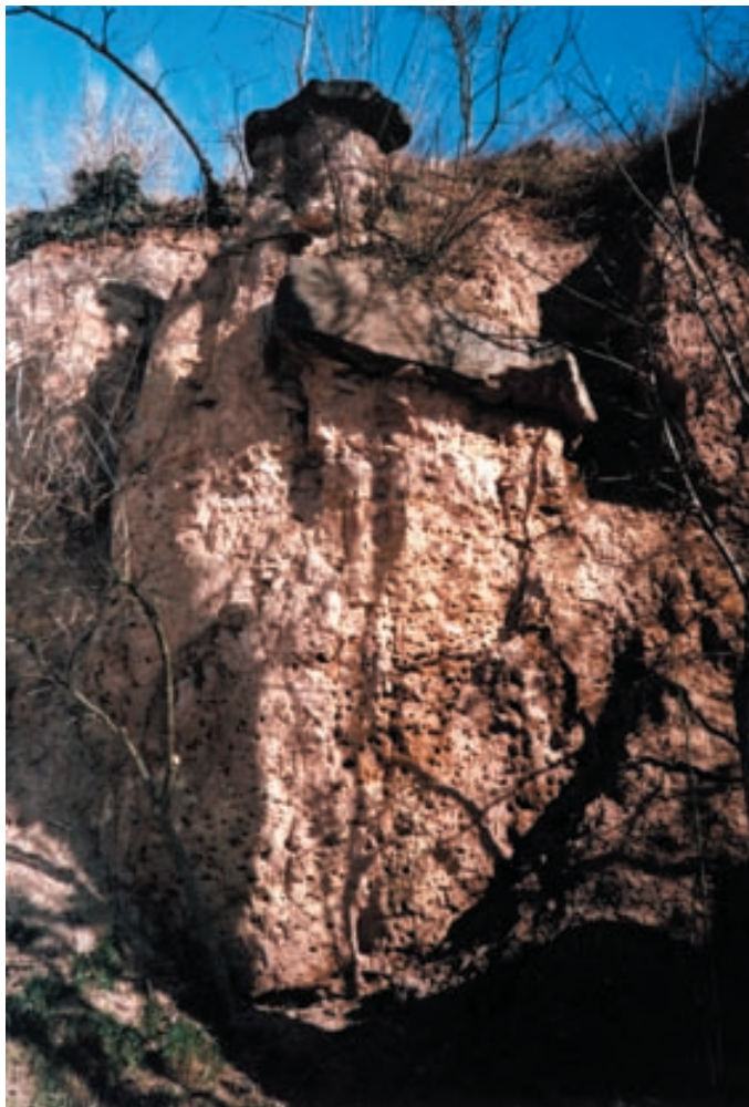
Obr. 2. Praha-Dejvice, Na Kotlářce 1, od roku 1957 Stadion mládeže. Deska a blok železitého pískovce ve stěně bývalé cihelny (foto V. Rybařík, 2011).

ale na základě analýzy výsledků na Petříně provedených šesti vrtů zpochybnil Jaroslav Valečka (VALEČKA 2005), protože v nich prý takovéto pískovce ve využitelných mocnostech zastíženy nebyly (a mj. ani dnes odkryty nejsou). Zdá se tedy pravděpodobnější, že jejich nalezištěm byla již zmiňovaná lokalita v Dejvicích pod Hanspaulkou anebo jinde na okraji křídového pokryvu. To mj. naznačil už Jaroslav Jiljí JAHN (1929), když za jejich možný zdroj kromě Peruce připouštěl i starý lom nad Starými Dejvicemi. Jaký lom měl na mysli, není známo, protože v pozdějším soupisu pražských lomů, pískoven a hlinišť (PROKOP 1951) žádný lom na katastru Dejvic evidován nebyl a v současné husté zástavbě také zjištěný není. S největší pravděpodobností to ale byl lom na severním okraji křídového souvrství někde mezi Petřínem a Bílou horou.