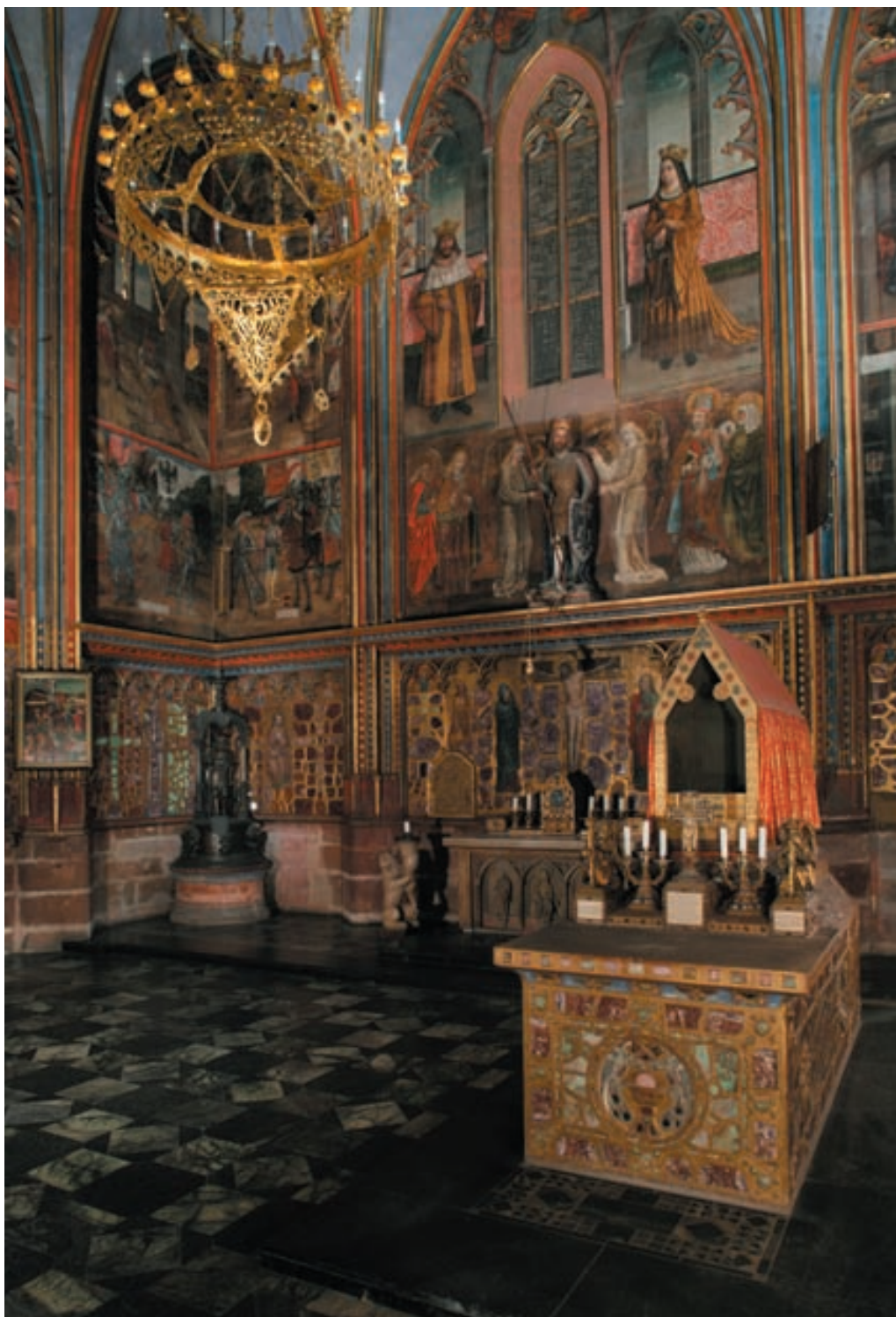
Obr. 6. Praha 1-Hradčany, Katedrála sv. Víta. Kaple sv. Václava s opukovou sochou sv. Václava nad opukovým oltářem sv. Jana Evangelisty a s inkrustacemi z převážně podkrušnohorských drahých kamenů (© Správa Pražského hradu, J. Gloc, 2007).

Zcela výjimečně je v pražských středověkých památkách zastoupena různě zeleně zbarvená přeměněná hornina hadec neboli serpentinit. Známý jsou jen dva případy, oba z katedrál sv. Víta a oba v podobě řezaných a broušených dlaždic. Starším a již výše zmíněným příkladem jsou hadcové dlaždice v dlažbě baziliky sv. Víta, Václava a Vojtěcha, objevené v roce 1911 pod