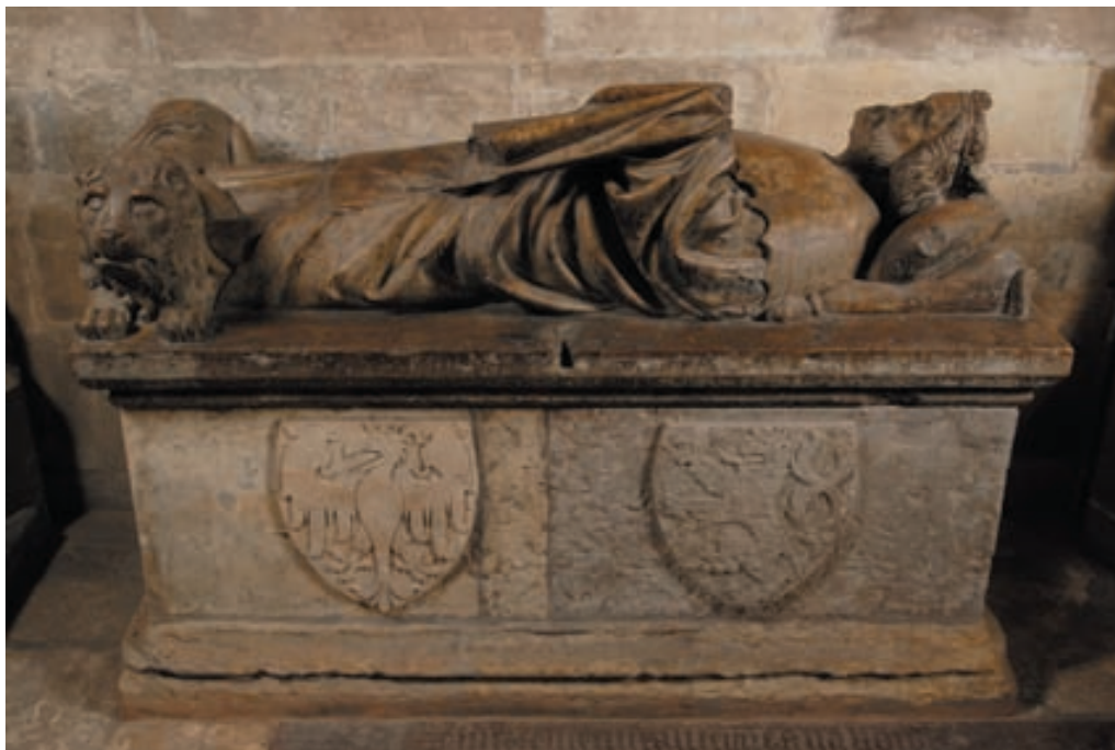
Obr. 1. Praha 1-Hradčany, Katedrála sv. Víta. Opuková tumba Přemysla Otakara I. Petr Parlář 1377.

horečná výstavba samotného Nového Města, jeho kostelů, klášterů a obytných domů (jen těch bylo v letech 1348–1351 postaveno asi 650), a také na Vyšehradě (přestavba Královského okrsku a baziliky sv. Petra a Pavla aj.), k čemuž byla využívána rovněž především petřínská opuka. To znamenalo, zejména v prvních dvou letech, na Petříně nalámat, upravit, naložit a na druhou stranu Vltavy převézt (navíc jen po dřevěném provizoriu místo zříceného Juditina mostu anebo brody) obrovské množství opukového kamene, tedy něco těžko pochopitelného i z dnešního hlediska. Použití opuky při výstavbě Nového Města dokládají dnes jen některé tehdy nově založené nebo přestavěné původní kostely, na kterých zůstaly dodnes neomítnuté části opukového zdiva. Z těch nově založených se v této podobě zachovaly kostely sv. Jindřicha, sv. Kateřiny (věž), Zvěstování Panny Marie Na Trávníčku nebo sv. Michala. Je velmi pravděpodobné, že alespoň zčásti z opuky jsou i jiné tehdy založené a nyní omítnuté novoměstské kostely sv. Štěpána, sv. Apolináře, Panny Marie Sněžné, Nanebevzetí Panny Marie a Karla Velikého nebo kostel a klášter v Emauzích aj. Přestavěny byly také původně románské kostely sv. Petra na Poříčí a sv. Václava na Zderaze.