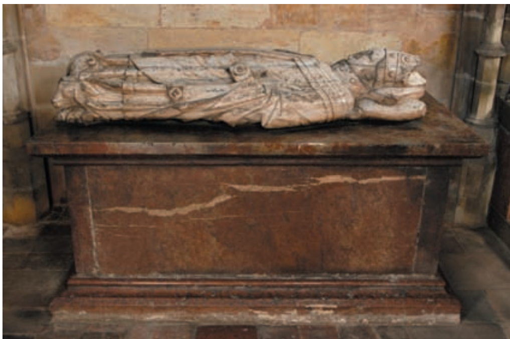
Obr. 5. Praha 1-Hradčany, Katedrála sv. Víta. Mramorová tumba arcibiskupa Jana Očka z Vlašimě († 1380) v kapli sv. Jana Nepomuckého.

Zbývající gotické mramorové artefakty jsou z různě červeně zbarvených leštitelných vápenců různé provenience. Pravděpodobně ze sliveneckého mramoru jsou desky nad hroby čtrnácti